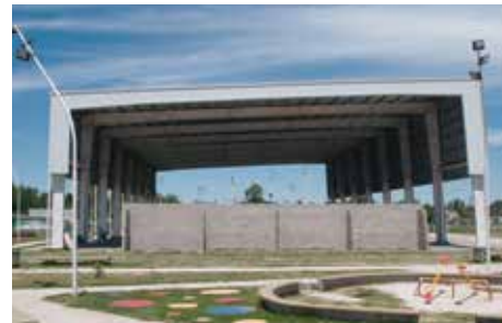
● Parque recreativo de av. Thevenet y Alfonsina Storni, barrio Villa Angélica.