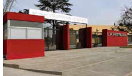
● Polideportivo La Patriada, av. Novak y Bonn, barrio Santa Rosa.